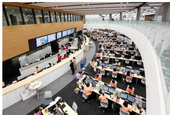
吹き抜け構造のコールセンター