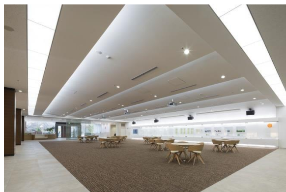
1Fレセプションホール