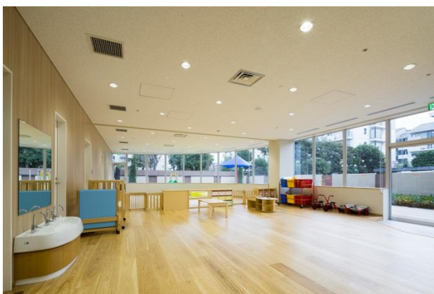
社屋内に設けられた託児所。4月からは子ども・子育て支援制度により認可保育園となった