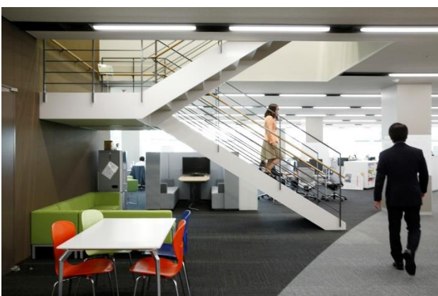
2つのフロアをつなぐ内階段と、階段まわりに配されたコミュニケーションスペース