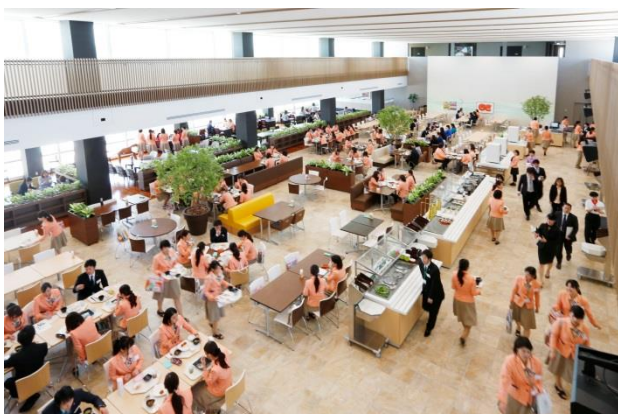
健康にこだわったメニューを1日3食提供する社員食堂